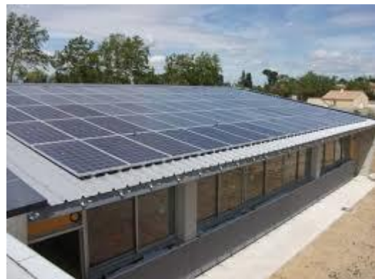
Groupe scolaire de Cruscades